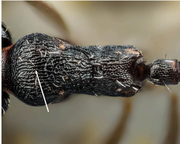
Pronoto estriado de O. magnus

- Cabeza más larga que ancha (HL/HWb 1.036-1.143). Pronoto en vista dorsal con un patrón reticulado y con estrías más superficiales ..... saulcyi