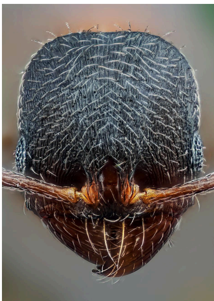
Cabeza de O. saulcyi

- Cabeza más larga que ancha (HL/HWb 1.036-1.143). Pronoto en vista dorsal con un patrón reticulado y con estrías más superficiales ..... saulcyi