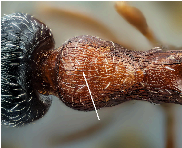
Pronoto reticulado de O. saulcyi