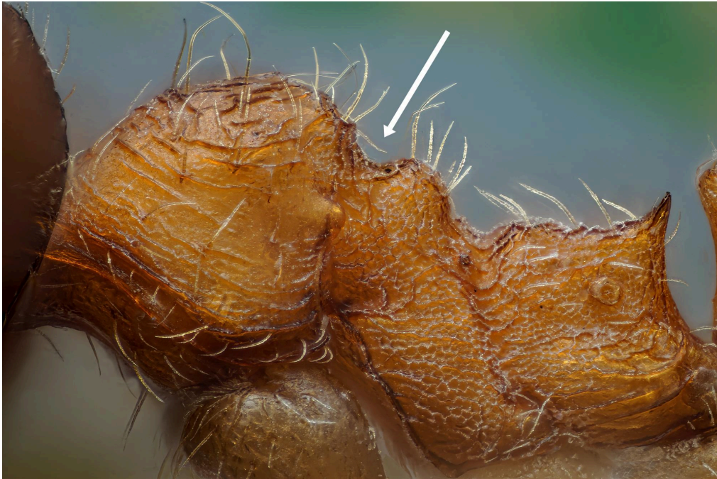
Mesonoto con fisura profunda de P. indica

2. El mesonoto presenta una fisura profunda ..... P. indica