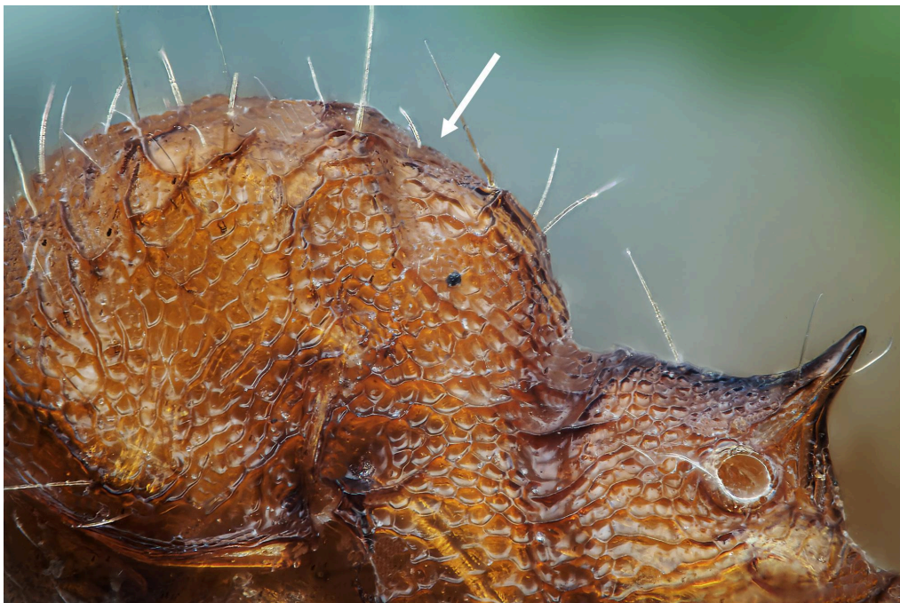
Mesonoto sin fisura profunda de P. navigans

- Mesonoto sin fisura profunda ..... P. navigans