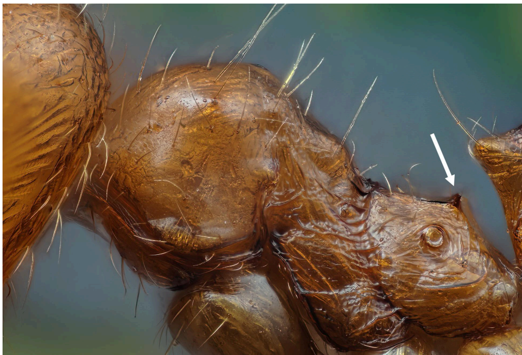
Espinas cortas de P. pallidula ,

- Espinas del propodeo cortas y poco pronunciadas ..... P. pallidula