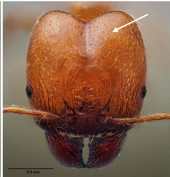
Cabeza lisa de P. pallidula