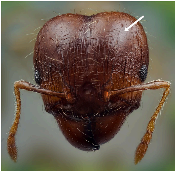
Cabeza lisa de P. megacephala