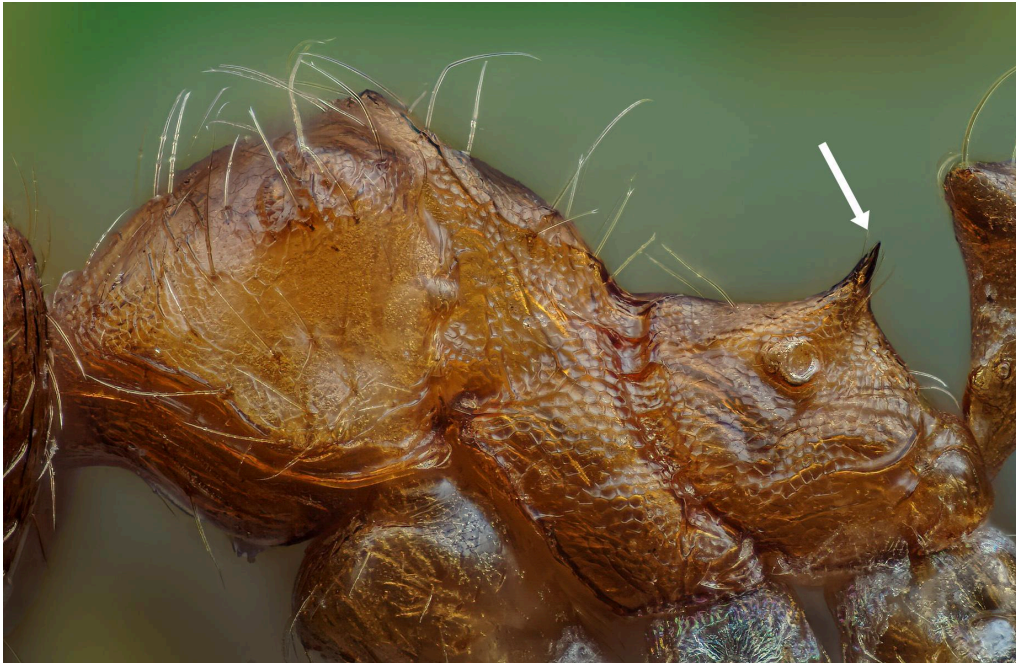
Espinas bien definidas de P. megacephala ..

3. Las espinas del propodeo se encuentran claramente definidas ..... P. megacephala