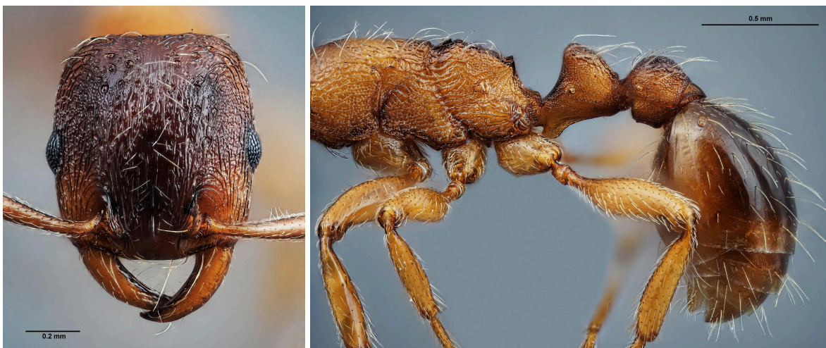
Cabeza, propodeo y peciolos en vista lateral de S. huberi

2. Tegumento menos brillante en cabeza, mesosoma y peciolos debido a la microescultura puntuada y reticulada. Margen posterior y costados de la cabeza más curvados. Ojos más grandes (EYE/CS 0.190 \pm 0.004 ). Espinas propodeales más desarrolladas (SPST/CS 0.208 \pm 0.014 ) y peciolo más triangular ..... huberi