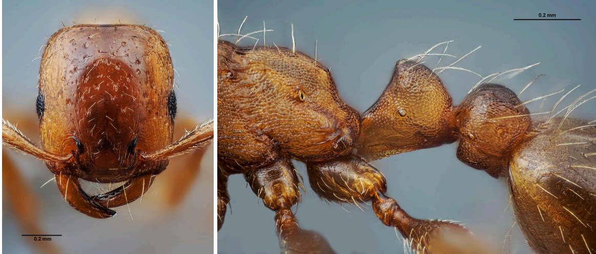
Cabeza, propodeo y peciolo en vista lateral de S. caeciliae

- Tegumento de aspecto más brillante, no tan reticulado. Margen posterior y costados de la cabeza más rectos. Ojos más pequeños ( EYE/CS\ 0.161 \pm 0.007 ). Espinas propodeales menos desarrolladas ( SPST/CS\ 0.156 \pm 0.007 ). Peciolo menos triangular ..... caeciliae